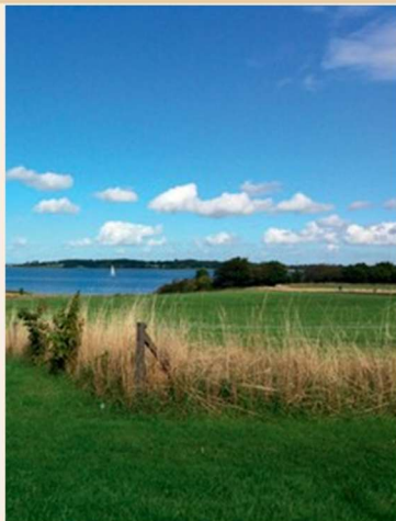
Foto: Roskilde Fjord